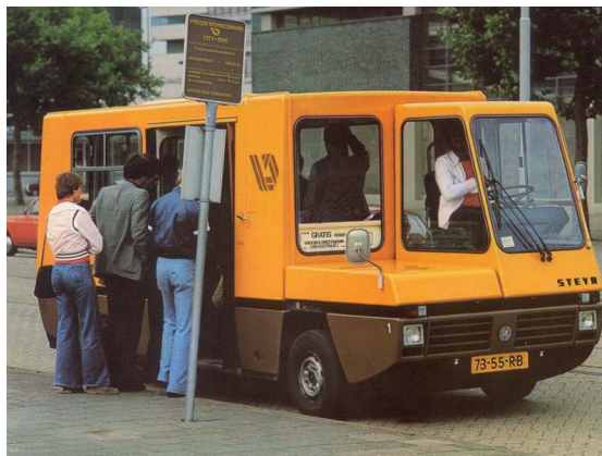
De V&D City-Bus in Rotterdam fungeerde in 1977 als gratis schakel tussen parkeerplaats en warenhuis.