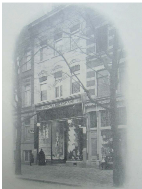
De zogenaamde 'sigarenzaakjes' Jonker Fransstraat en Van der Takstraat (rechts) in 1912.