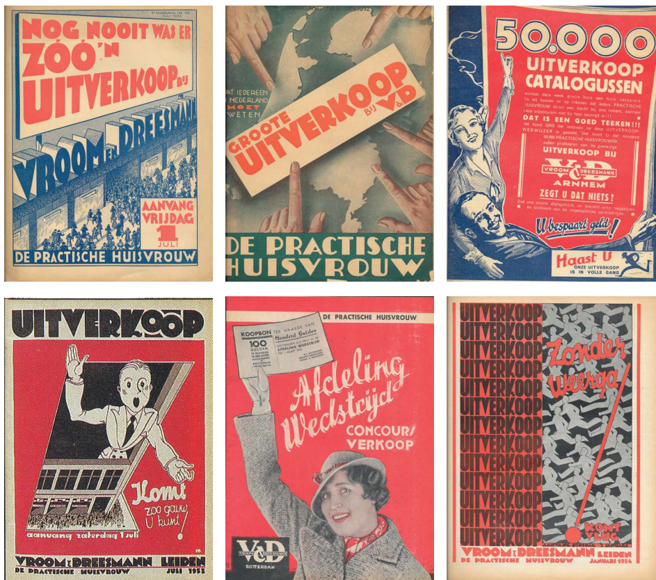
Voorbeelden van uitverkoop folders van Vroom & Dreesmann in de periode 1932-1934.

In de crisisjaren rond 1930 probeerde ieder Vroom & Dreesmann filiaal extra werk te maken van de uitverkoop. Ieder half jaar mocht er een opruiming of uitverkoop worden georganiseerd en bij V&D heerste dan voorafgaand aan deze dag een bijzondere uitverkoop sfeer. Op 2 januari begon