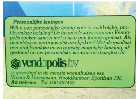
Vendoto, Vendahoy, Vendair en Vendopolis waren voorbeelden van dienstverlenende activiteiten van het Vroom & Dreesmann concern.

Er kwamen ook andere (dienstverlenende) activiteiten bij zoals dameskappers en verhuisafdelingen in grotere vestigingen, de Veranda's voor tuinbenodigdheden en tuinmeubelen, de Vendoto voor autoaccessoires en autoshops. Bij Vendoto kon men kleine reparatie- en montagewerkzaamheden laten verrichten en er was een zelfbedienings-benzinestation en in een aantal gevallen een automatische wasstraat. De Vendoto was verbonden aan het warehouse of in de onmiddellijke omgeving ervan. V&D zag ook een toekomst voor Vendoe't voor doe-het-zelf-benodigdheden met sanitair, bouwmaterialen, hout dat via een pick-up service bij het warehouse kon worden opgehaald. Kansen waren er ook voor Vendomus woninginrichtingswinkels en Vendahoy voor caravans, zeil- en motorboten. Verder kon je later bij V&D een vakantiereis regelen met Vendair, een auto huren en verzekeringen kon je afsluiten via Vendopolis. Ook kreeg menig nieuw V&D-filiaal een opticien met de naam VendOptieken en had menig warehouse een kindercreche binnen haar muren. Vanaf 1975 was er de Vendoprint 'de sneldrukkerij waar