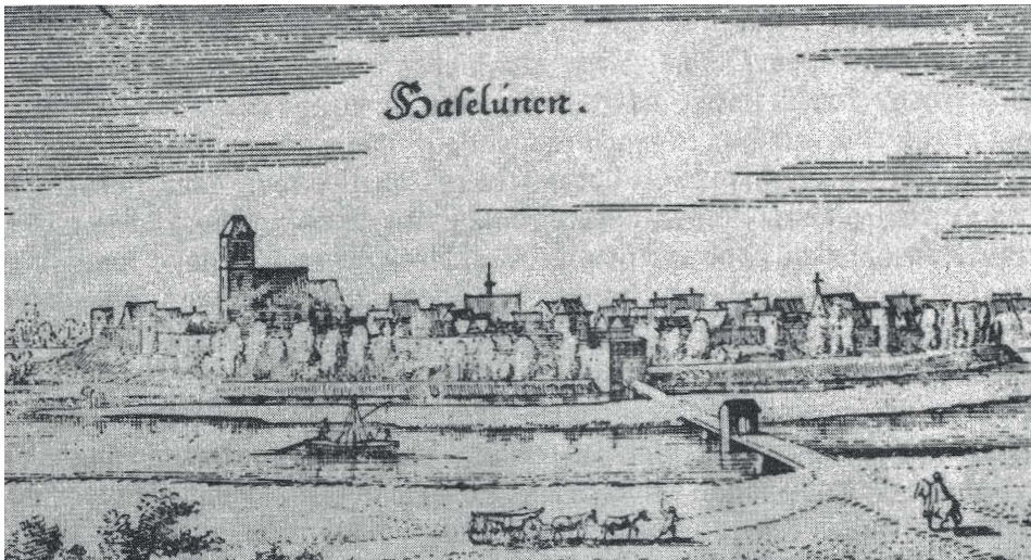
Haselünne (D), woonplaats van de Dreesmann familie.